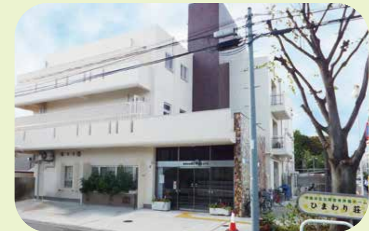
所管:世田谷区障害福祉部障害者地域生活課